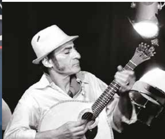
Le Chant des Voiles, quand Véretz devient lisboète p.12