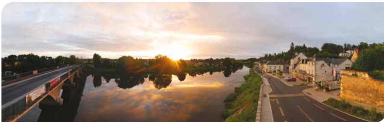
Lever du jour sur Véretz