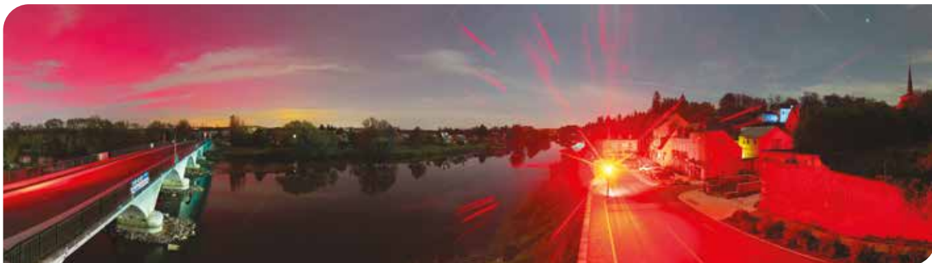
Des aurores boréales à Véretz

www.skaping.com/montlouis-vouvray/veretz .