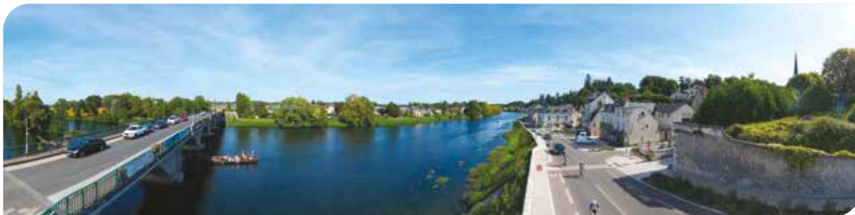
Balade en fûteau sur le Cher