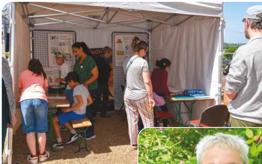
Bibli en Fête

De janvier à juin, la bibliothèque de Vézetz invite petits et grands à partager lectures, découvertes et convivialité.