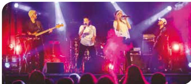
Station Kaameleon en concert samedi 4 juillet à 19h30.

Entre esprit festif, engagement local et cadre naturel exceptionnel, cette 17 e édition coche toutes les cases. Alors, que vous soyez en famille, entre amis ou simplement curieux... une chose est sûre : cet été, ça se passe sur les berges ! V.PINHEIRO