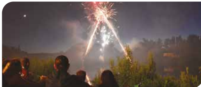
Feu d'artifice samedi 4 juillet à 23h.