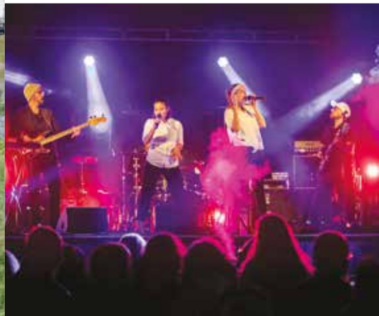
17 e Fête des Berges Véretz passe en mode été ! p.12