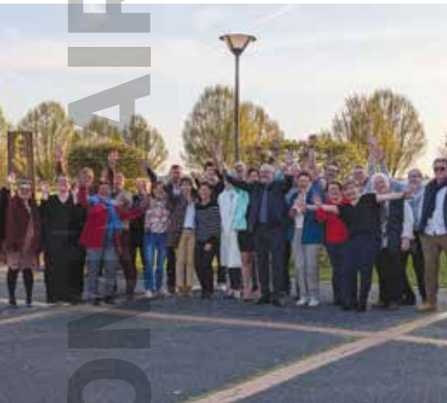
Nouvelle équipe municipale Un cap pour Véretz p.6