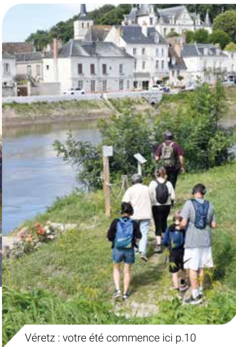
Véretz : votre été commence ici p.10